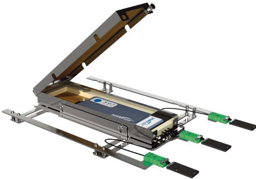
图 2 带有智能连接界面的 DeltaProbe 炉子验证工具

本产品的设计和开发就是为了解决传统手工设置温度曲线存在的问题，给制造商提供一个更精简的周期性测试温度曲线的方法。DeltaProbe 提供工艺控制，使制造商的复杂生产智能化，不再需要每天使用脆弱的测试板对炉子进行检查。