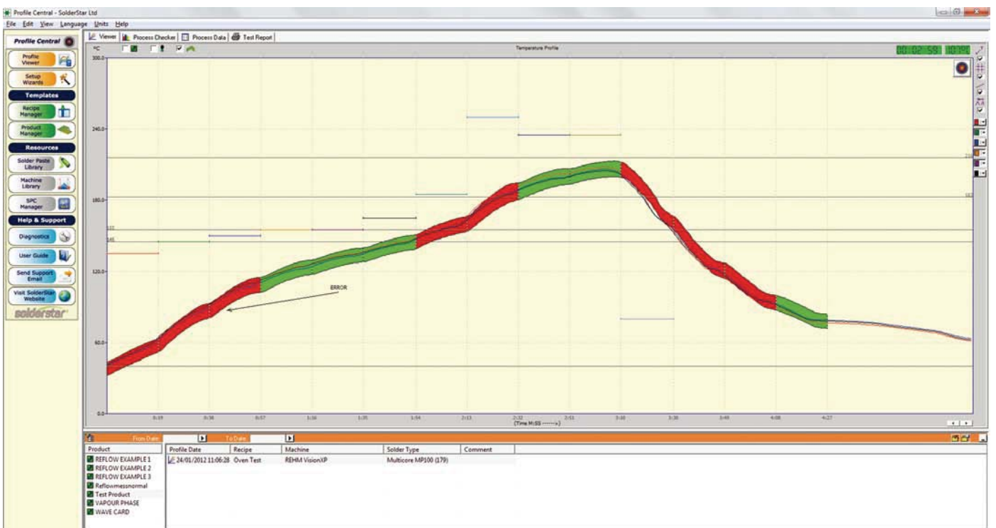
图 3 炉子验证工具准确地绘制回流焊温度曲线