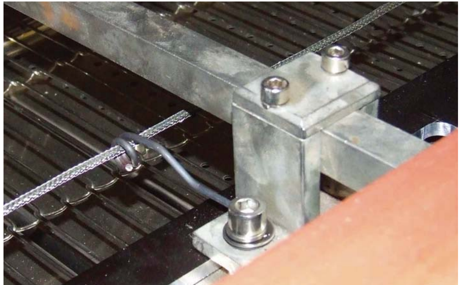
图4 一个典型的探针

温度和速度是否设置正确，快速反馈热电偶、输送装置和风扇故障。监控炉子工艺参数，保证正确输入，没有炉子过载。